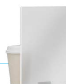
Матовое непрозрачное стекло