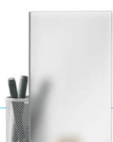
Сенсорное затемнение стекла