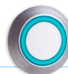
Диммер света и вентиляции