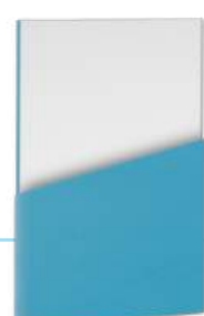
Прозрачная стенка вместо глухой